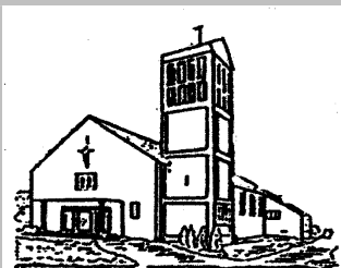
St. Theresia Schafbrücke Bischmisheim

Pfarrbüro Kirchweg 13 66133 Saarbrücken-Scheidt