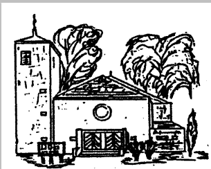
Hl. Familie Rentrisch