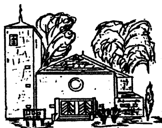
Hl. Familie, Rentrisch