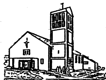
St. Theresia, Schafbrücke-Bischnisheim

Pfarrbrief Nr. 5 vom 26.04. bis 01.06.2008